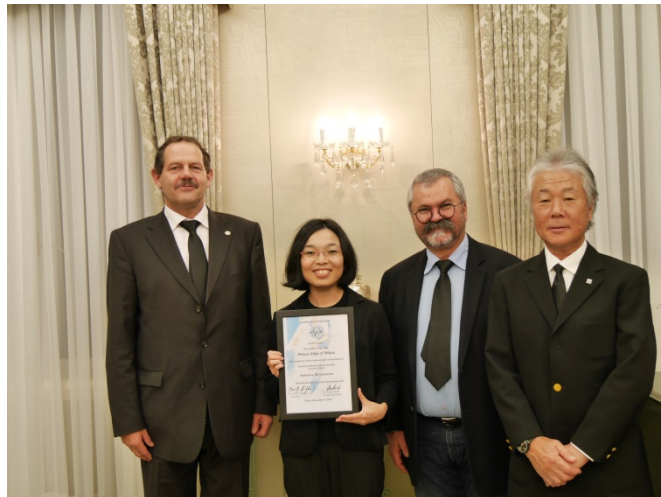
Übergabe der Ehrenurkunde an die Prinzessin Akiko von Mikasa

Prinzessin Akiko hat selbst eine Skilehrerausbildung beim Japanischen Berufsskilehrerverband SIA abgeschlossen.