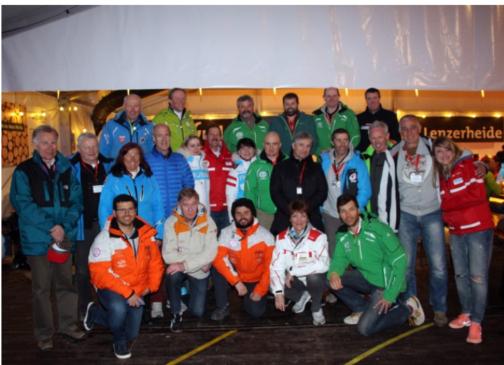
Vertreter der ISIA-Mitgliedernationen an der Abschlussparty des Swiss Snow Happenings in der Lenzerheide.