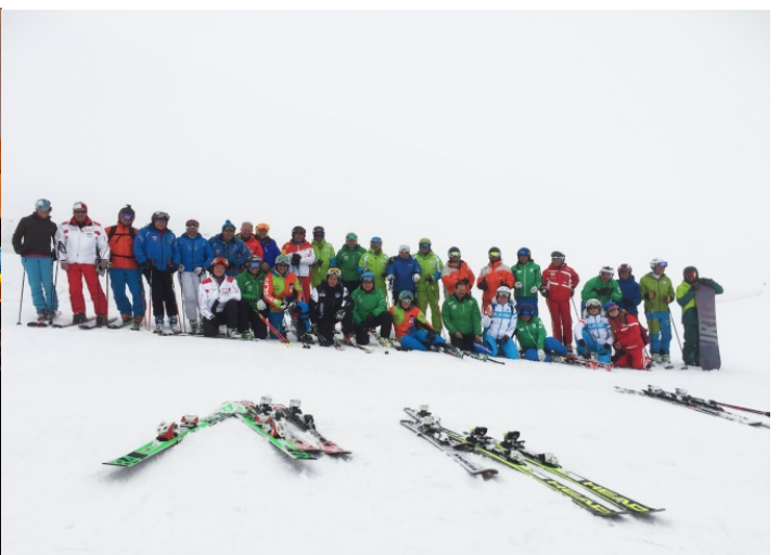
ISIA-Skitag in der Lenzerheide